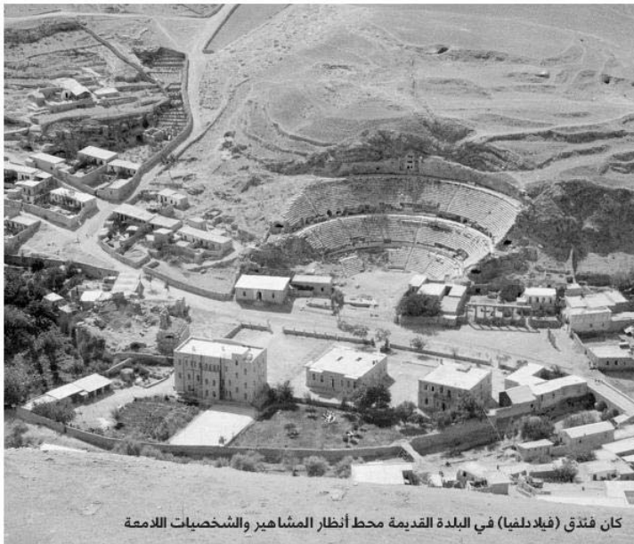
كان فندق (فيلادلفيا) في البلدة القديمة محط أنظار المشاهير والشخصيات الالامعة