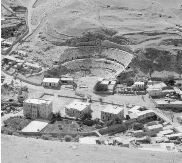
The Philadelphia Hotel (bottom left) was the place to be and be seen in the 1920s.